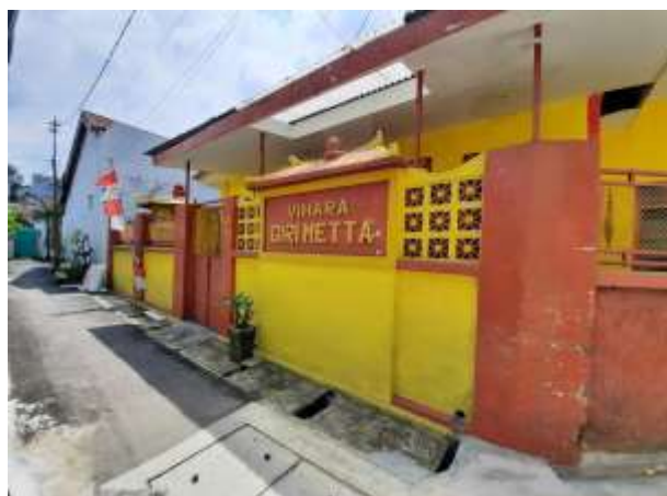
Gambar 2. Vihara Giri Metta