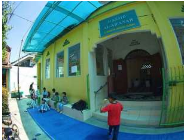
Gambar 1. Masjid Jami Al Amanah

dapat hidup sendiri dan selalu membutuhkan bantuan orang lain sehingga berusaha untuk dapat meringankan beban tetangga yang mendapat musibah.